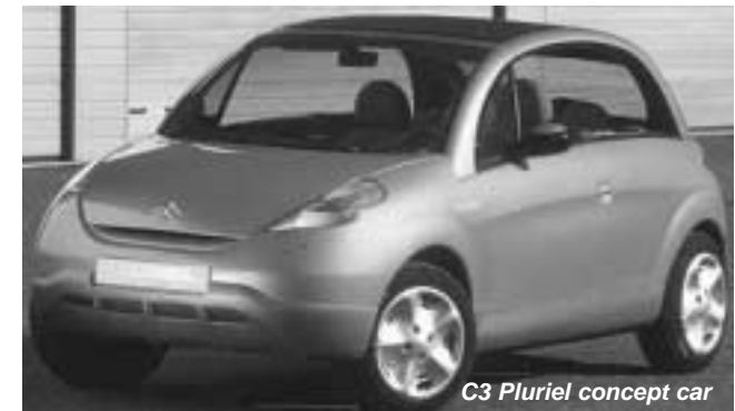
C3 Pluriel concept car