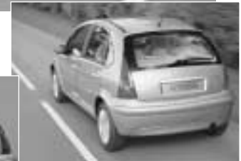
C3 dans sa version définitive

une modularité incroyable : elle sera non seulement découvrable, comme notre chère et tendre deuche, mais les arches de caisse subsistantes seront amovibles et la banquette arrière sera totalement escamotable. Tout ça permettrait d'en faire donc une berline, une décapotable ou un pick-up, selon les besoins du moment... Pour découvrir C3 en live, rendez-vous au salon de l'Auto qui se tiendra du 17 au 27 janvier au palais du Heysel à Bruxelles.