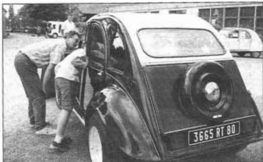
Peinture impeccable, vitrail à la vitre arrière : chacun vit sa 2 CV selon son goût.

« Bienvenue à Deudeuchland ! » C'est par ces mots, inscrits sur une banderole à l'entrée de l'enceinte cantonale, qu'étaient accueillis les amateurs et visiteurs, le week-end dernier, au pays des 2 CV.